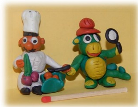
WYKONANIE — PRZEMEK TEKIELI

Od najmłodszych lat interesuję się plastyką. Codziennie coś rysuję, maluję lub kleję z plasteliny. Sprawia mi to wiele radości, a nawet muszę przyznać, że stało się to moją pasją. Dzień bez rysunku czy plastelinowej figurki to dla mnie dzień stracony. Chodzę także na szkolne kółko plastyczne, które wszystkim polecam. Mam zamiar dalej rozwijać swoje zainteresowania, a moim marzeniem jest uczęszczać do Akademii Sztuk Pięknych.